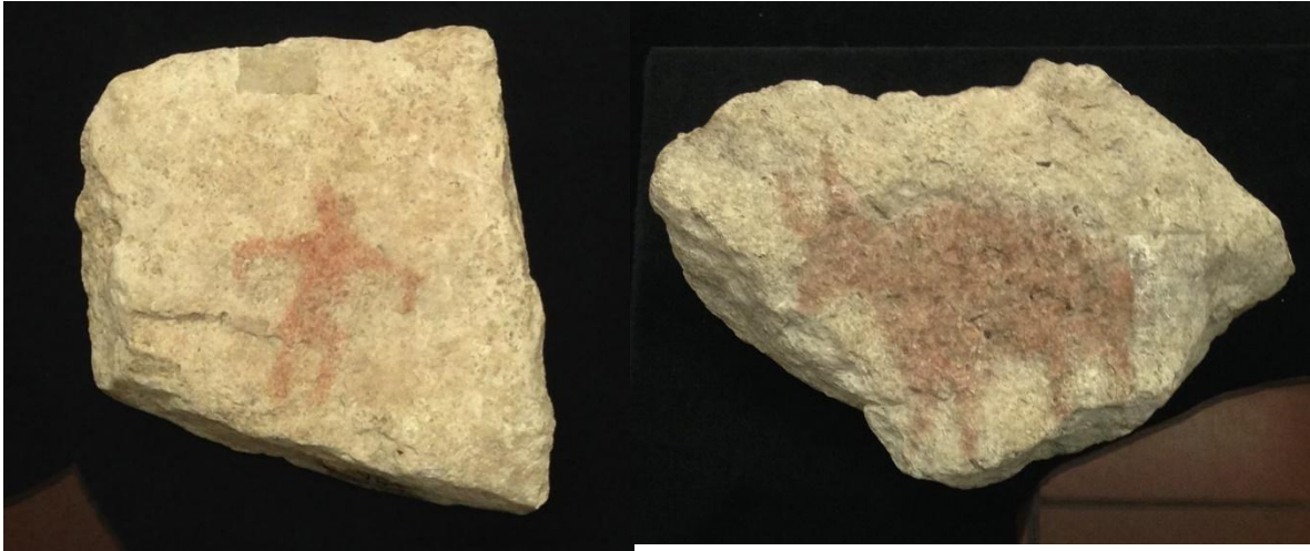
Abb.5 : Bemalte Steine, Riparo Dalmeri, Museo Muse.

Mit so vielen erdgeschichtlichen Eindrücken erfüllt fuhren wir weiter ins Hotel, in welchem wir uns beim Abendessen an landestypischem Essen erfreuen konnten.