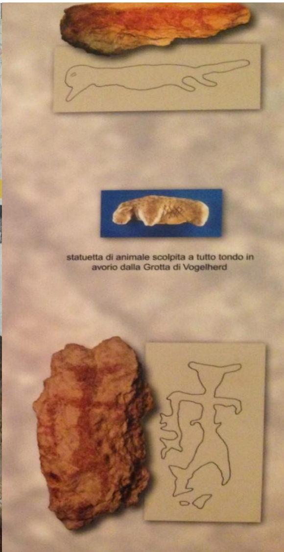
Abb 10: 2 Repliken der bemalten Kalksteine, Museo Preistorico, San`t Anna d`Alfaedo.

Auf den weiteren 4 Steinen befinden sich Motive von einem Tier, einem Ring, einer vollständigen, aber ungeklärten Darstellung sowie einem unvollständigem, wahrscheinlich animalischem Objekt.