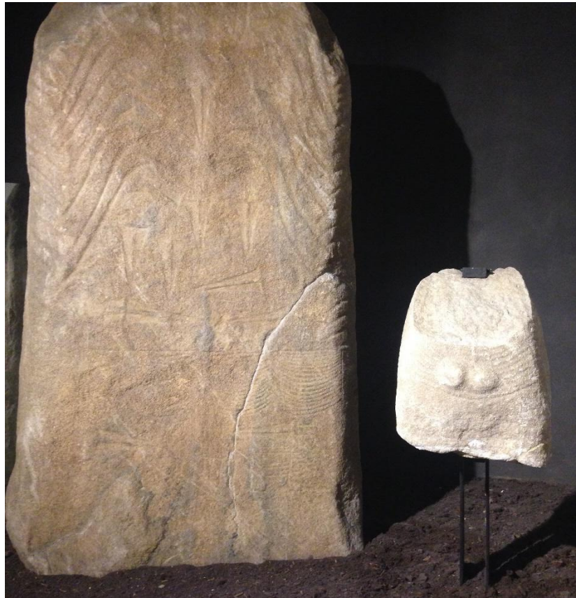
Abb.1 : Repliken der Menhire II und I im Südtiroler Archäologiemuseum.