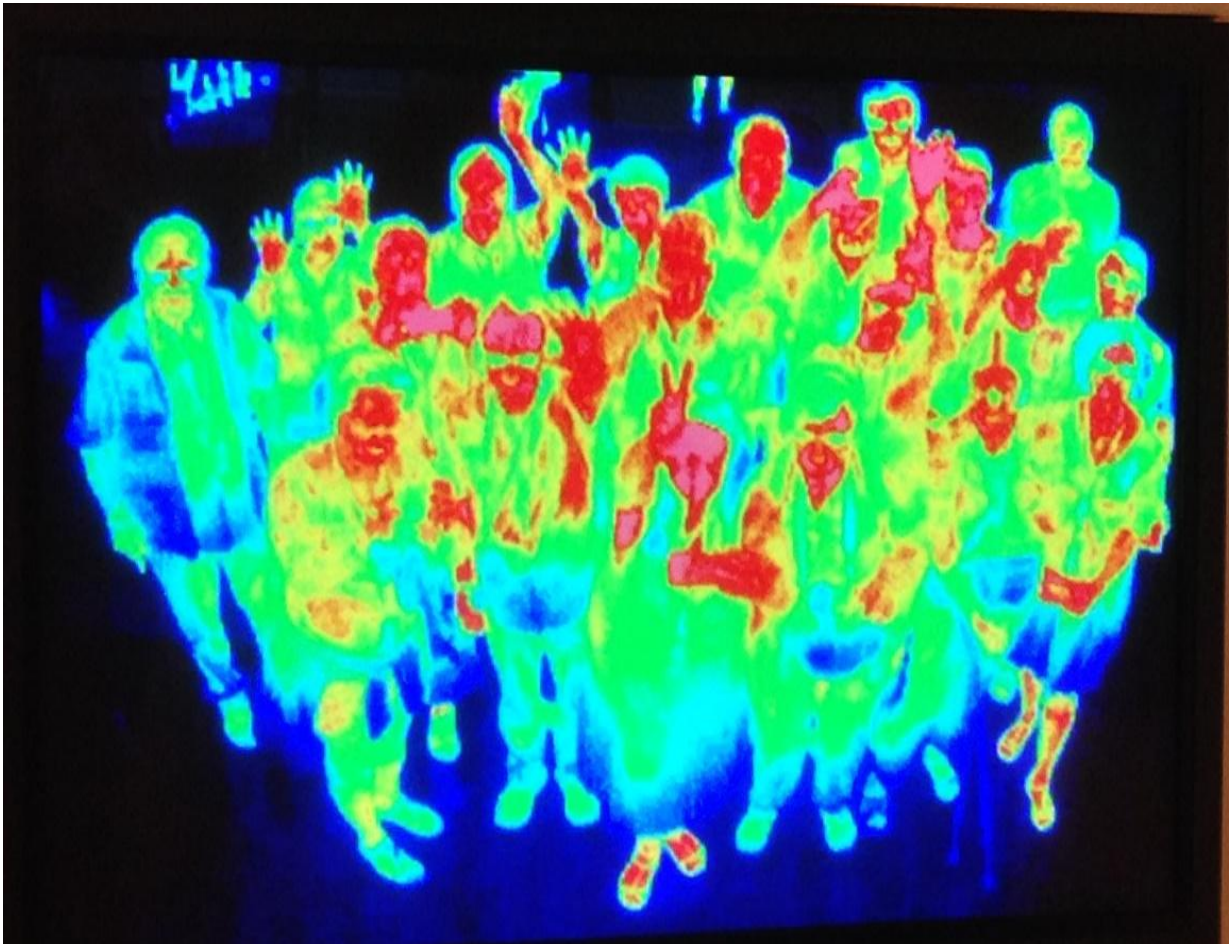
Abb 4.: Einblick ins „Innere“ der GfU...

Zu der erstaunlichen Erkenntnis, dass das schlichte Huhn der noch nächste lebende Verwandte der Dinosaurier ist, erlaubte uns eine Wärmebildkamera eine ganz neue Form des Gruppenbildes: Ohne Datenschutzprobleme !