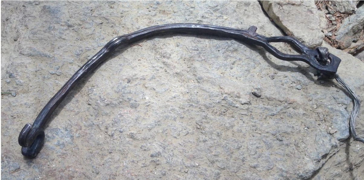
Abb. 11: Rätischer Hausschlüssel, archäologischer Lehrpfad Hohe Birga.

Dieser eindrucksvolle „Ausflug“ in die Eisenzeit bildete dann den inhaltlichen Abschluss unserer diesjährigen äußerst vielfältigen Exkursion, die uns ja schon vom Neolithikum über Epigravettien, Aurignacien bis zum Mousterien geführt hatte. Mit so vielen denkwürdigen Eindrücken im geistigen Gepäck konnten wir dann am frühen Abend auch dank der wie immer kompetenten und sicheren Fahrweise von Frau Steeger wohlbehalten nach Blaubereuren zurückkehren.