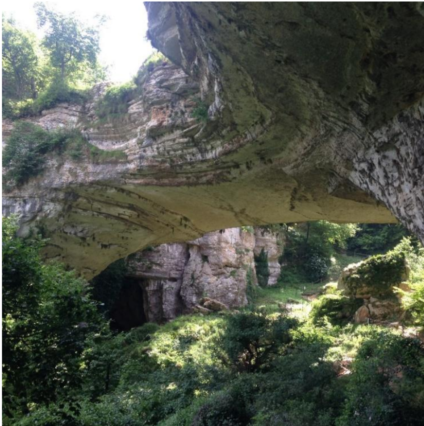
Abb 6.: Ponte di Veja und unteres Höhlengelände.

Mittels eines Fußmarsches gelangten wir zunächst auf dieses Überbleibsel des einstigen Höhlendaches, genossen die grandiose Aussicht und folgten dann unserer Führerin hinab in das unterhalb liegende, ebenso faszinierende Höhlengelände. Hier und in der weiteren Umgebung finden sich einige ehemals von Neandertalern und dem modernen Menschen bewohnte Höhlen, in welchen seit 1932 zahlreiche Ausgrabungen stattfanden. Dabei fanden sich neben Höhlenbärenknochen Steinartefakte aus dem Mousterien als auch Stein- und Knochenwerkzeuge aus dem Aurignacien und späten Gravettien, dem hier in Südeuropa sogenannten Epigravettien.